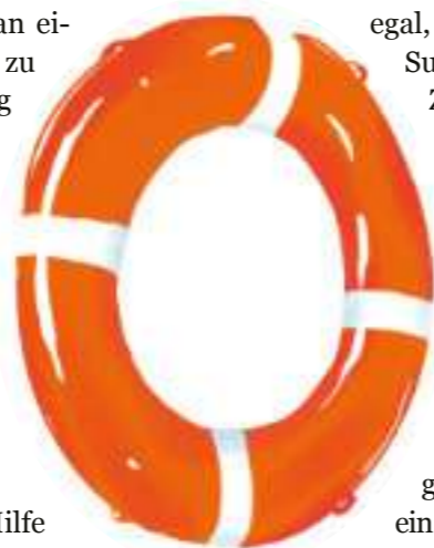
© Porträt Jan Pries: Friedrich Bernstorff | © Illustrationen Rettungsring & Palmen: Collage: Susanne Winkler / Mallo & Hollyfox

Die Selbsthilfegemeinschaft Mellendorf begleiten Menschen dabei, wieder Hoffnung und neue Perspektiven zu finden. (ms mit Herrn Hein)