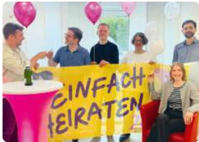
Das Team „Evangelisch in der Wedemark“ ist schon in Feststimmung und freut sich auf Euch!

Ihr könnt allein kommen oder Familie, Freundinnen und Freunde mitbringen. In Kirche, auf der Wiese unter Bäumen und im Gemeindehaus ist von der Sektbar bis zum Café alles vorbereitet. Paare, die sich für den 26. Juni eine kirchliche Trauung mit Eintrag in